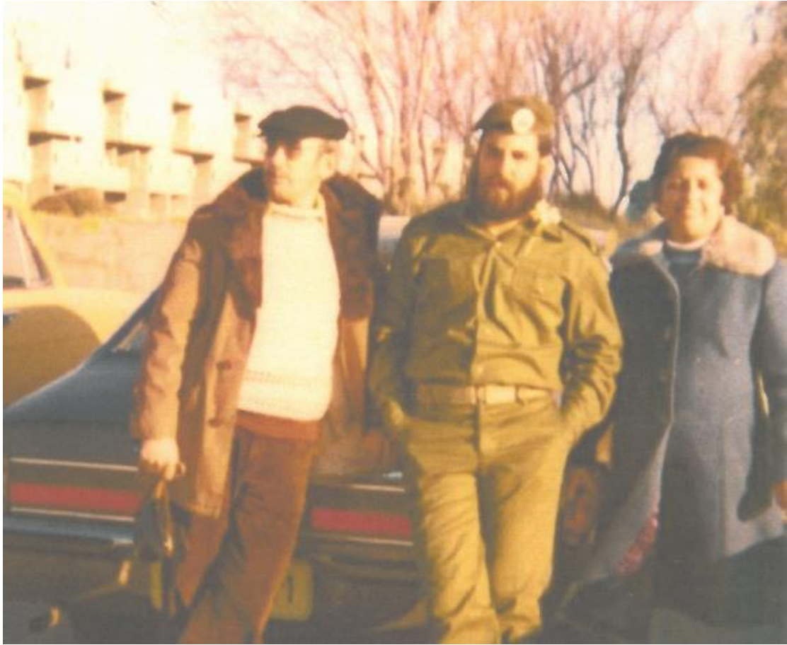
תמונה מסיום קק"צ, 1980.